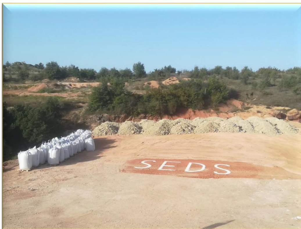
Site de stockage SEDS en Macédoine du Nord

Parce que la valeur réelle bat la valeur monétaire : toujours, et plus que jamais en ces temps.