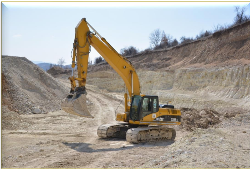
Bentonit/Diatomit-Mine in Nordmazedonien

Die Notwendigkeit der Kaufkrafterhaltung in wirtschaftlich turbulenten Zeiten hat die Schweizer Einkaufsgenossenschaft für Digitalisierte Sachwerte - SEDS schon Anfang 2022 bewogen, rechtzeitig in unverarbeitete Grund- oder Rohstoffe wie zum Beispiel in Diatomit zu investieren.