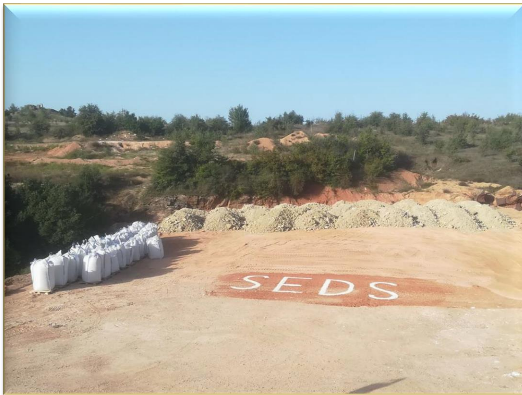
SEDS-Lagerplatz in Nordmazedonien

Denn Sachwert schlägt Geldwert: immer, und in Zeiten wie in diesen mehr denn je.