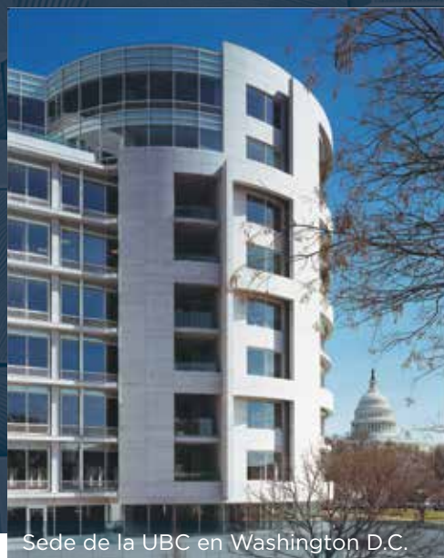
Sede de la UBC en Washington D.C.